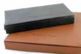
Box di presentazione