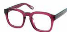
Eyecatch - Raspberry Baret