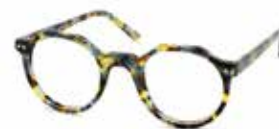
Eyecube - New World