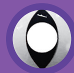
WHITE CAT EYE (VERSIONE MENSILE)