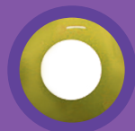
SOLID YELLOW (VERSIONE MENSILE)