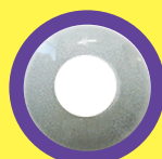
SOLID WHITE (VERSIONE MENSILE E GIORNALIERA)