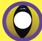
YELLOW CAT EYE (VERSIONE GIORNALIERA)