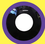
SOLID BLACK (VERSIONE MENSILE E GIORNALIERA)

DISPONIBILI SIA NELLA VERSIONE MENSILE CHE GIORNALIERA