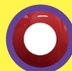
SOLID RED (VERSIONE MENSILE E GIORNALIERA)